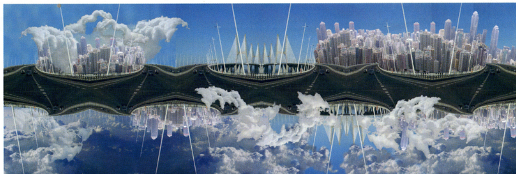
La Route Infernale, de Lisbonne à Hong Kong. Denise Demaret-Pranville, photomontage, 2010.

Une vue de Hong Kong (depuis le pic dominant la ville) et deux vues de nuages (prises d'avion) complètent cette route impossible. L'auteure a ensuite varié sur le thème. En effet, l'œuvre présentée au concours fait partie d'un triptyque, que nous révélons ci-dessous.